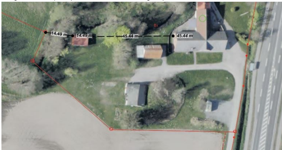
Bilag: Situationsplan (ikke målfast i denne udgave)