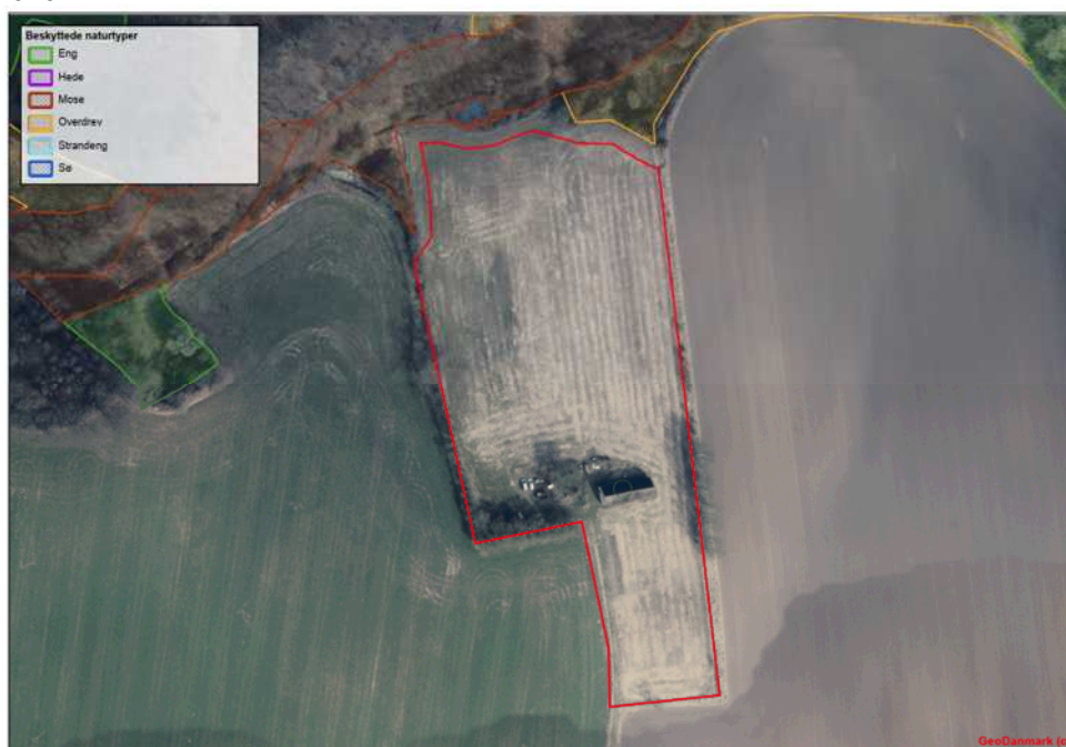
Figur 1 - Skovrejsningsområde er markeret med rød streg

Frederikshavn Kommune modtog den 23. februar 2026 anmeldelse om skovrejsning på i alt 1,76 ha på matr.nr. 29a, Den Sydlige Del Hørby, beliggende ved ejendommen på Bredmosevej 33, Hørby, 9300 Sæby. Med senere tilretning af projektet, den 18. marts 2026.