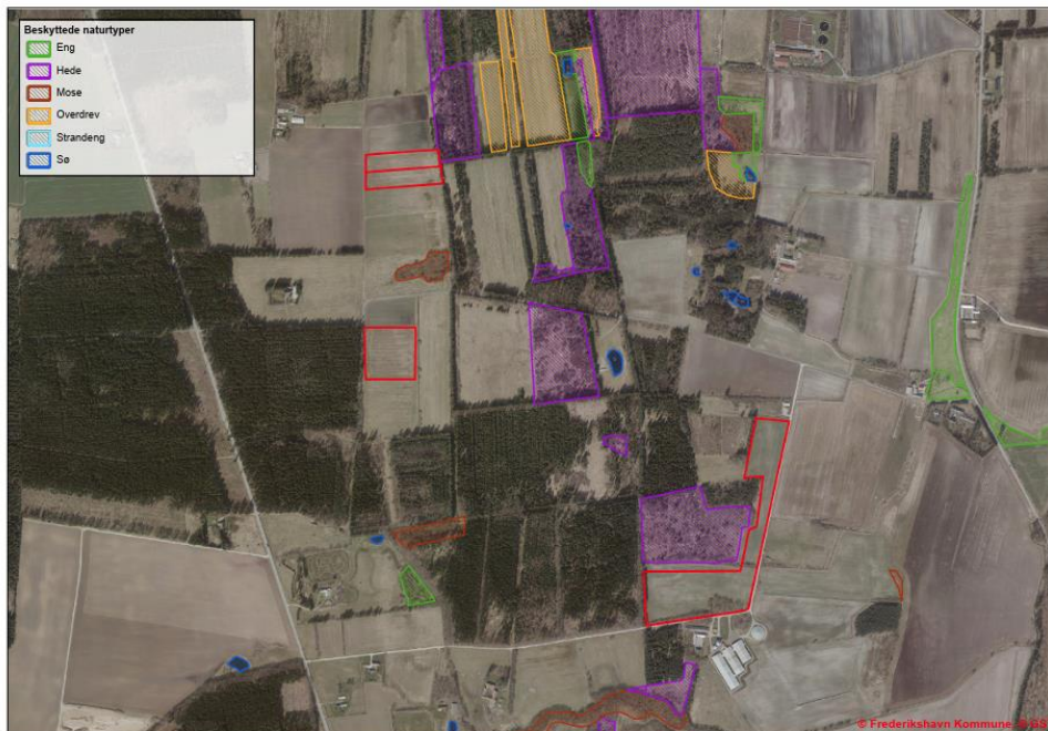
Figur 1 - Skovrejsningsområderne er markeret med rød streg

Sagsbehandler: Thit Thurah Bilde Nielsen Direkte telefon: +45 9845 5636