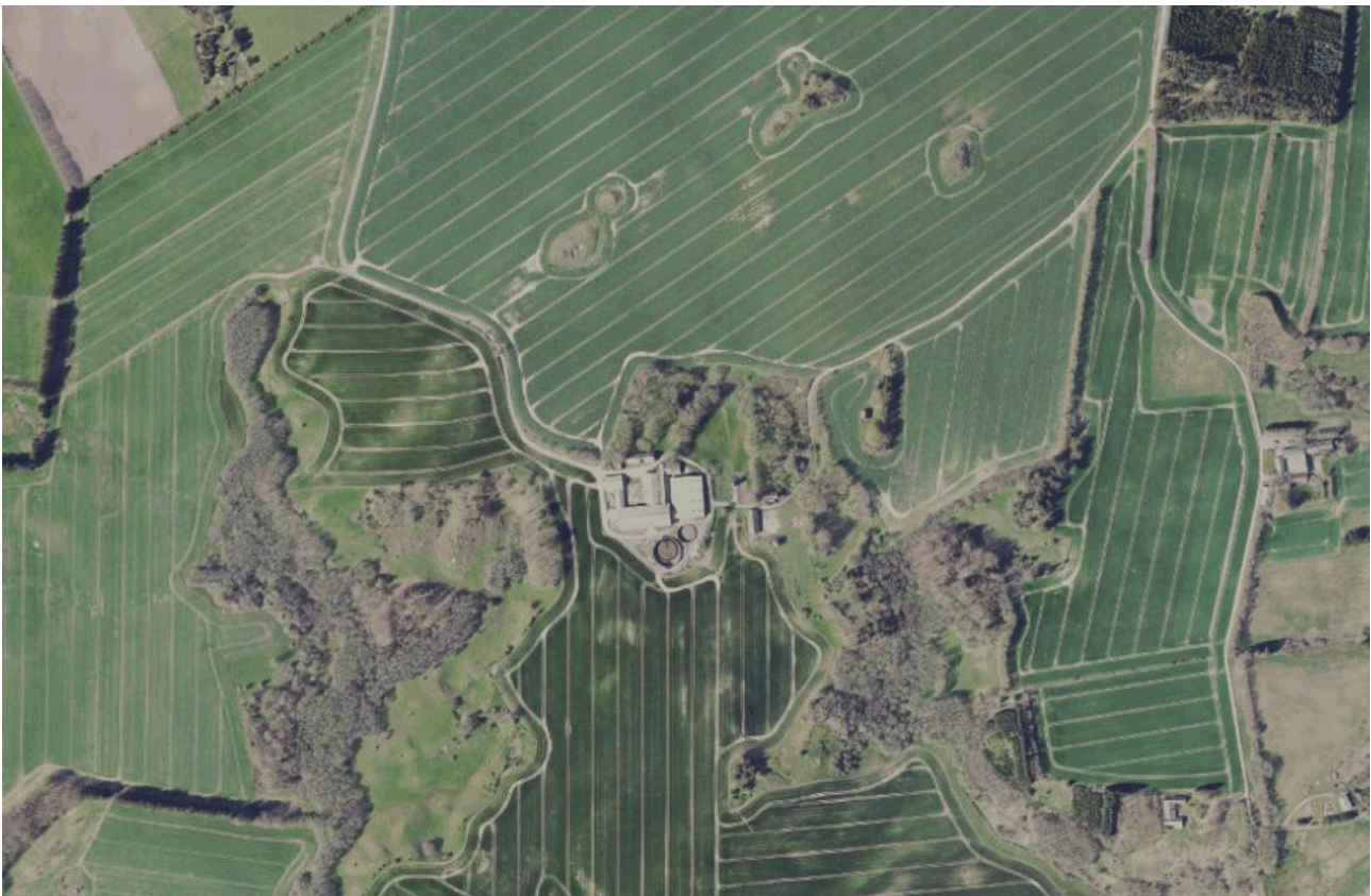
Figur 2. Oversigtskort, der viser ejendommens placering i forhold til naboer. Gyllebeholderen er vist med en rød prik.

Gyllebeholderen ligger syd for og i tilknytning til ejendommens øvrige bebyggelse. Som det fremgår af Figur 2 så er der ingen nabobeboelser som kan blive generet af indsynet en overdækning. Der er meget bevoksning omkring ejendommen, som virker afskærmende.