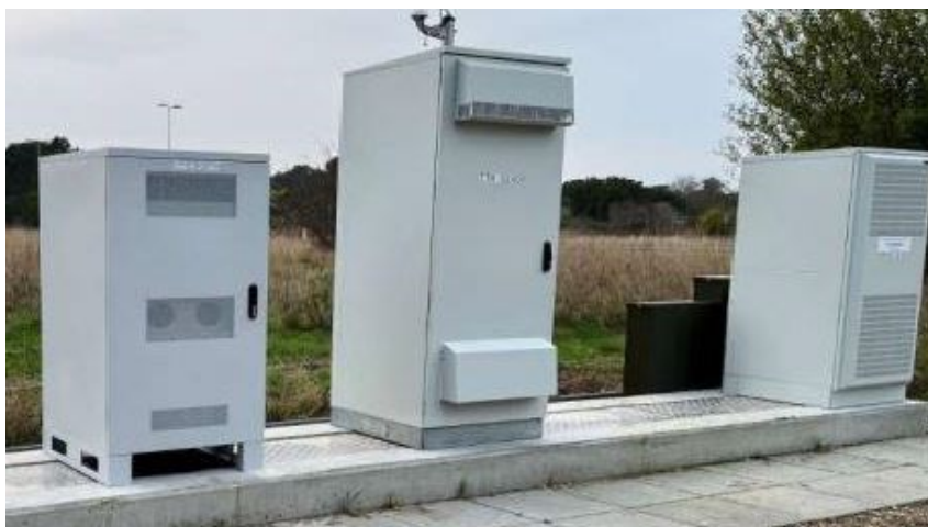
Bilag: Referencefoto tilhørende teknik