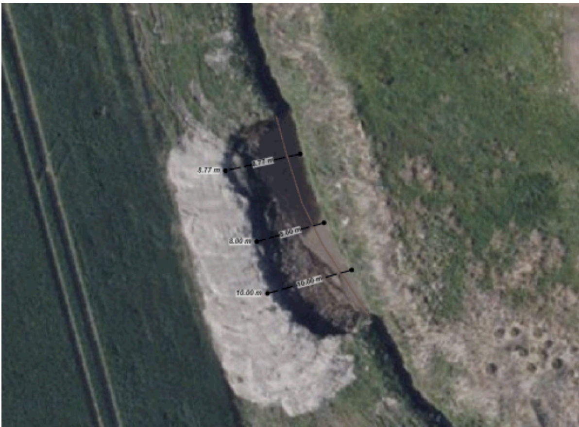
Kort 2 Sandfangets nuværende dimensioner samt omtrentlig placering af ny brink (rød streg).

Indsigelser og ændringsforslag til projektet skal modtages af kommunen senest XXX 2024.