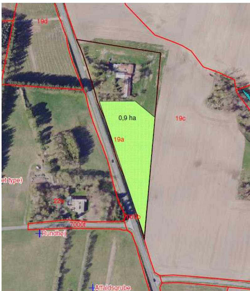
Kortudsnittet er taget fra ansøgningen om skovrejsning. Grøn markering angiver udbredelsen af ny skov.