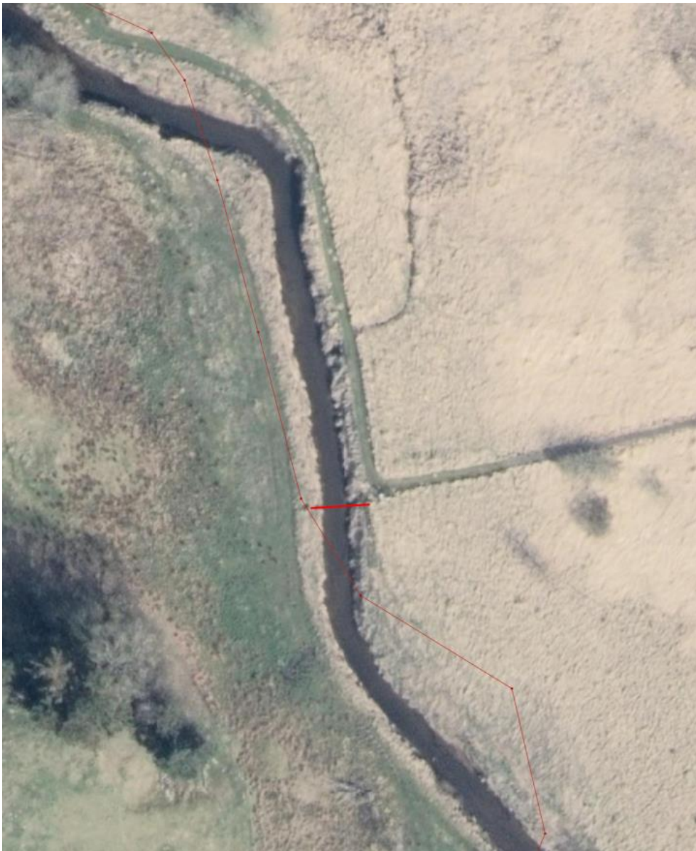
Kort 1 Placering af bro (rød streg).

Broen bliver op til 11 meter lang med ca. 140 cm fri gangbredde. Yderligere specifikationer ses i byggebeskrivelsen (Bilag).