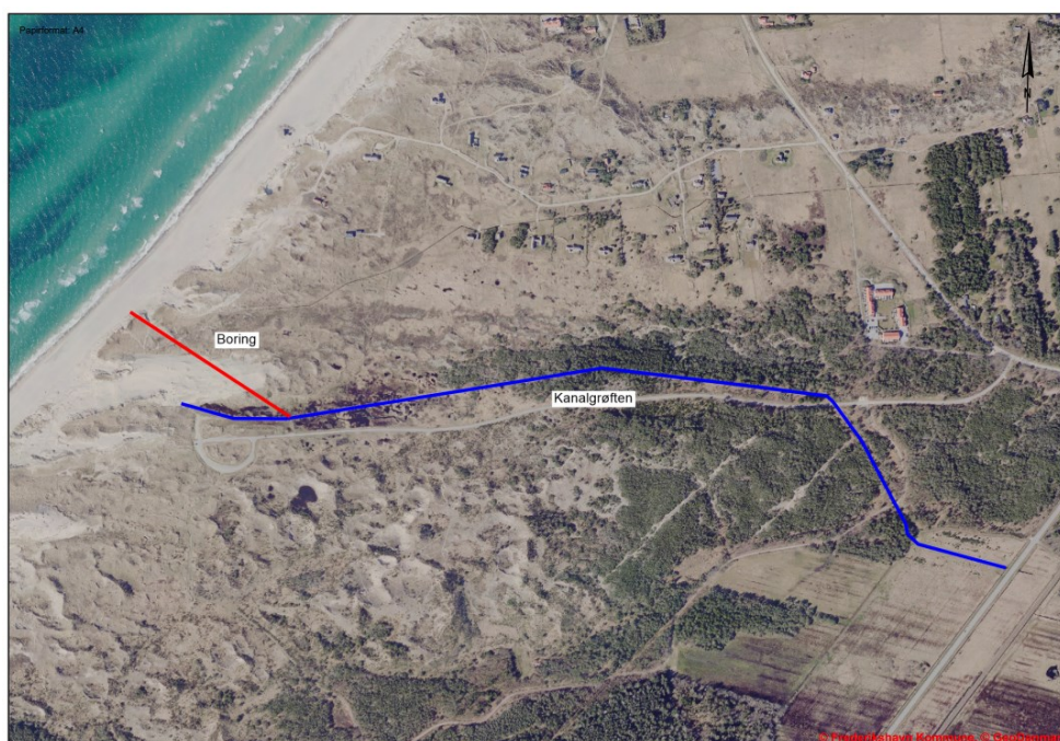
Figur 1: oversigtskort over Kanalgrøftens forløb og boringens placering. Afbildningen er blot en skitseret af det forventede forløb og ikke præcist aftegnet.

Naturstyrelsen har søgt om tilladelse til at underbore klitten. Underboringen gennemføres med et afløbsrør på forventeligt 400 mm og med en længde på ca. 330m. Boringens tiltænkte forløb samt Kanalgrøften ses på Figur 1 nedenfor. Tilslutning til Kanalgrøften vil ske ca. 150 m opstrøms grøften for gå fri af klitten ved den fortsatte vandring. Kanalgrøften har jf. ortofoto fra 1960-64 haft udløb til Højen grøft og ud i havet. Over tid har sandvandring forårsaget blokering af udløb fra grøfterne til havet. I dag slutter Kanalgrøften 195 m fra kliffoden og 260 m fra strandkant. Klitterne er fortsat i bevægelse.