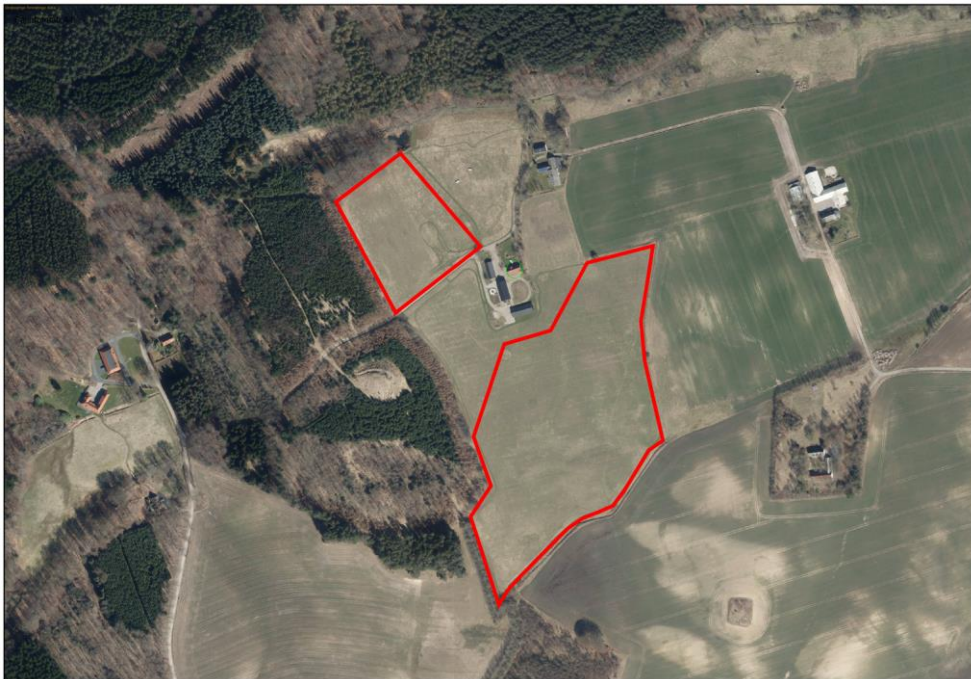
Figur 1: Kortudsnit over området (luftfoto 2026). De røde polygoner markerer områder, hvor der er ansøgt om skovrejsning.

Sagsbehandler: Thomas Bjørn E-mail: TMBJ@frederikshavn.dk Direkte telefon: +45 9845 6216