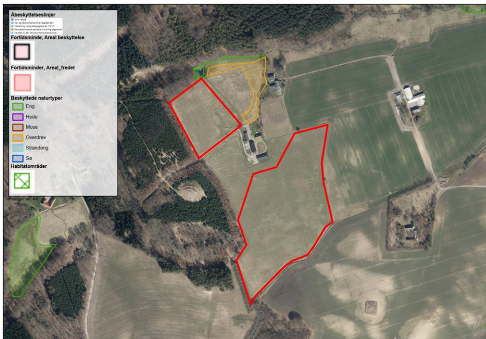
Figur 2: Kortudsnit over området (luftfoto 2026). De røde polygoner markerer områder, hvor der er ansøgt om skovrejsning. Kortlag for åbeskyttelseslinjer, fortidsminder (beskyttet og fredet areal), beskyttede naturtyper og habitatområder er slået til.

Etablering af skov de pågældende steder vurderes ikke at påvirke landskabet negativt, men vil i stedet tilføre området højere naturværdi, især hvis der vælges hjemmehørende arter og provenienser. Løvskov med velplanlagt skovbryn, vil med tiden være et værdifuldt levested for mange dyr og planter tilknyttet danske skovnaturtyper. Samtidig vil et skovområde forbedre de økologiske forbindelser i landskabet.