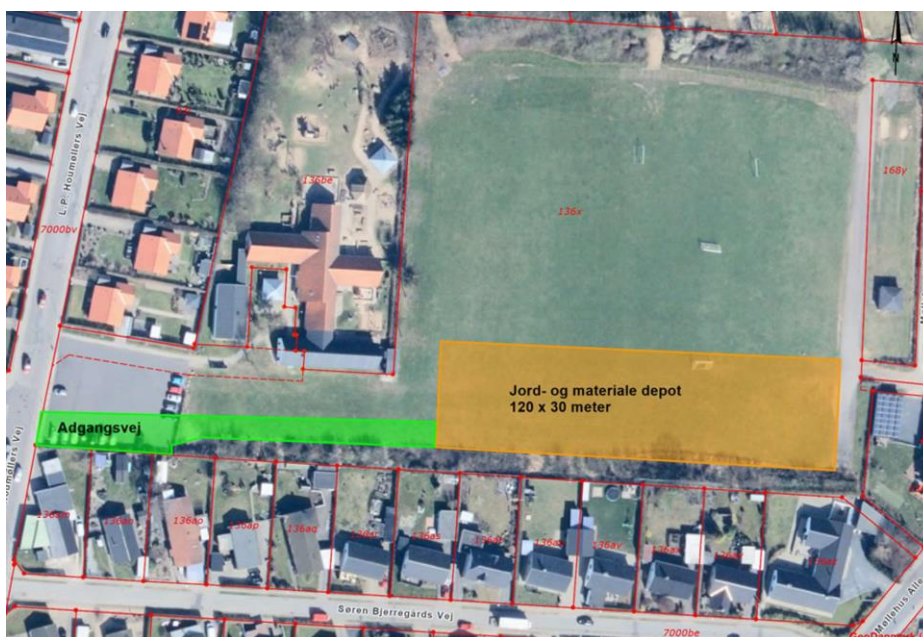
Figur 1 Placering af midlertidigt oplag af overskuds jord.

Der ønskes tilladelse til mellemdepot på sportspladsen beliggende på matr.nr. 136x, Bangsbo, Frederikshavn Jorder med beliggenhedsadresse L.P. Houmøllers Vej 19. Arealet er vist på figuren nedenfor.