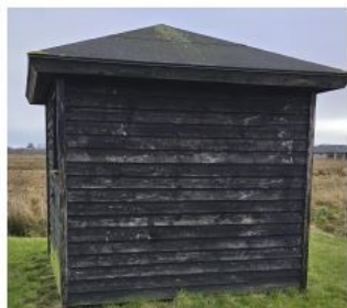
Bilag: Referencefotos af pumpehuset