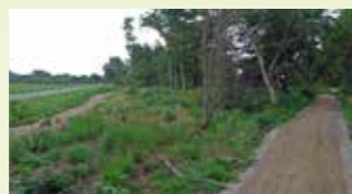
Stien i hundeskoven