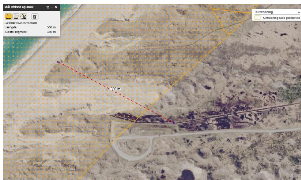
Figur 3, kortbilag fra ansøgningen, der viser den omtrentlige placering og forløb af den styrede underboring.

Der ønskes gennemført en styret underboring fra stranden til Kanalgrøften. Denne løsning er valgt for at foretage det mindst indgribende anlægsarbejde. Underboringen gennemføres med et afløbsrør på forventeligt 400 mm. Længden på underboringen vil være ca. 330 m, jf. nedenstående kort.