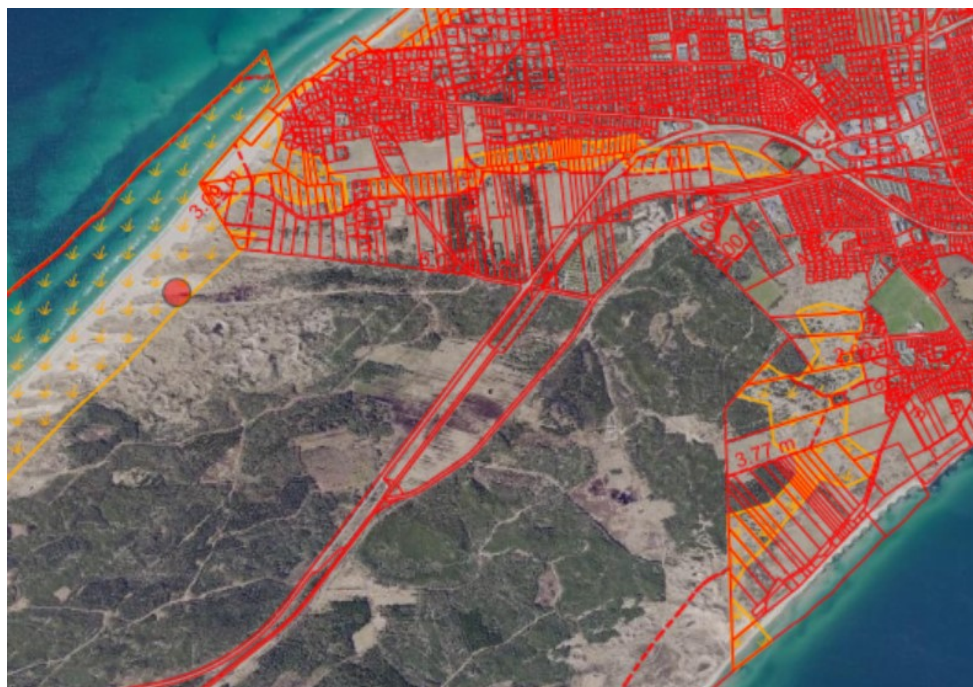
Figur 1. Ortofoto 2023. Det orange prikkede område markerer det klitfredede areal. De røde streger markerer de vejledende matrikelskel. Den røde prik viser det konkrete areal, der ansøges på.

Ejendommen matr. nr. 14es, Skagen Markjorder er beliggende på vestkysten syd for Skagen by, i Frederikshavn Kommune. Arealet er fredskovsnoteret og delvist beliggende inden for klitfredningen. Ejendommen er ejet af Naturstyrelsen.